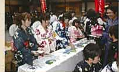
記念品は外宮 神楽殿前にて！