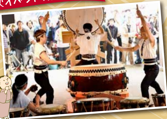
しん おん かん しゃ に ほん たい こまつり