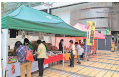
たまプラーザテラス(前回)